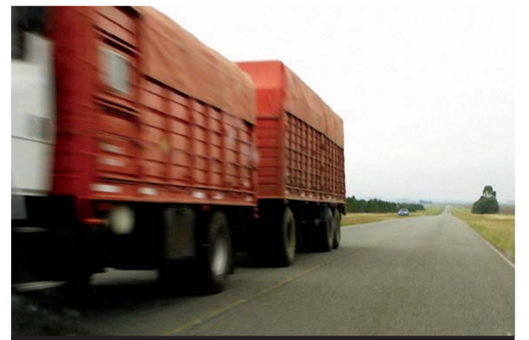
Pesos máximos y sus categorías en los transportes de carga

A.A.P.C. Asociación Argentina de Propietarios de Camiones