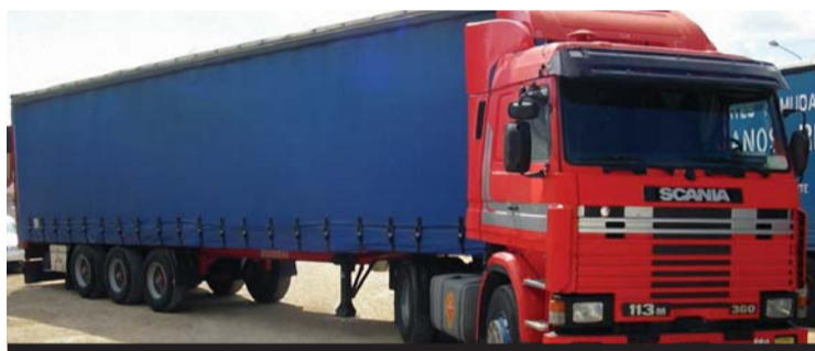
Revisión técnica obligatoria cada 6 meses

Asimismo, se determinan los ensayos estructurales y de flexo torsión, regulándose en torno al Certificado de Fabricación y los informes de homologación y habilitación.