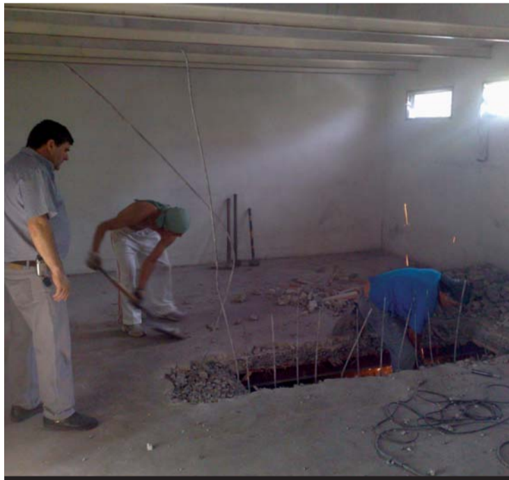
A fines de Julio la obra estará finalizada y en Agosto prestando servicio

La Comisión Directiva de la Asociación Argentina de Propietarios de Camiones encaró la construcción de la nueva sede de la entidad ubicada en Av. Montes de Oca 2178.